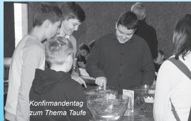
Konfirmandentag zum Thema Taufe