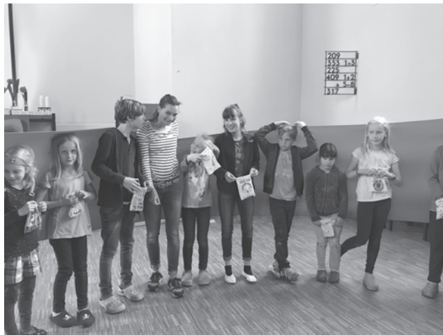
Kinder- Ferien- Woche 2017

Anmeldung und Info: Diakonin Elke Beutner-Rohloff Tel: 271 60 12 elke.beutner-rohloff@lister-kirchen.de