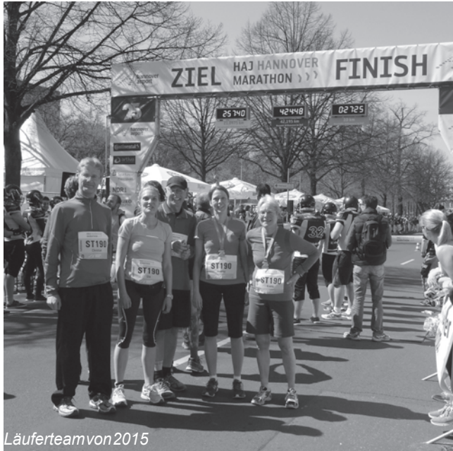
Läuferteam von 2015