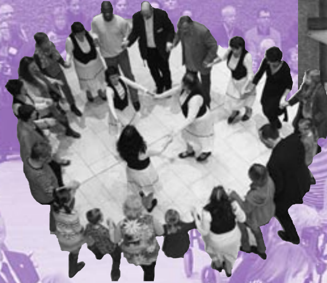
Die Tanzgruppe der Liberalen Jüdischen Gemeinde bittet zum Tanz.