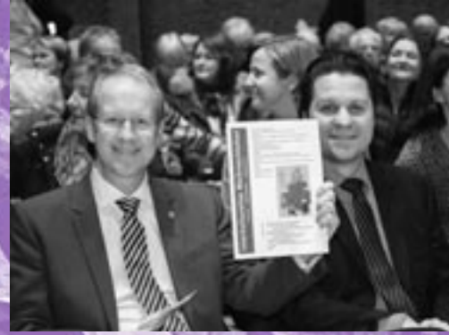
Oberbürgermeister Stefan Schostok und Alptekin Kirci vom Verbindungsbüro zur Landesbeauftragten für Migration und Teilhabe freuen sich auf den Gottesdienst.