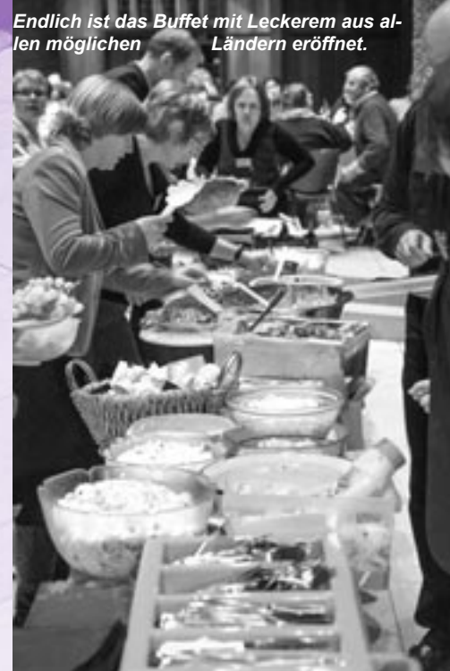
Endlich ist das Buffet mit Leckerem aus allen möglichen Ländern eröffnet.