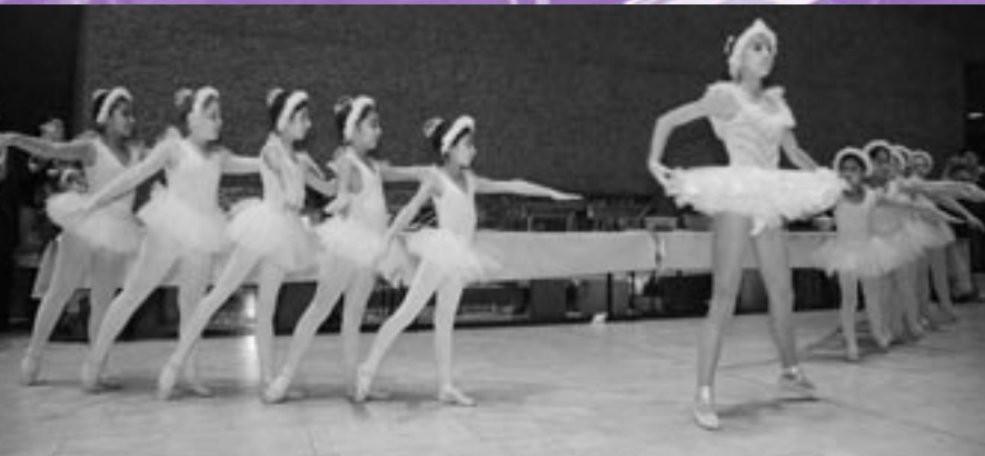
Jeder Schritt sitzt bei den Tänzerinnen der Ballettschule Feigin.

Tanz und Gesang von der Presbyterian Church of Ghana.